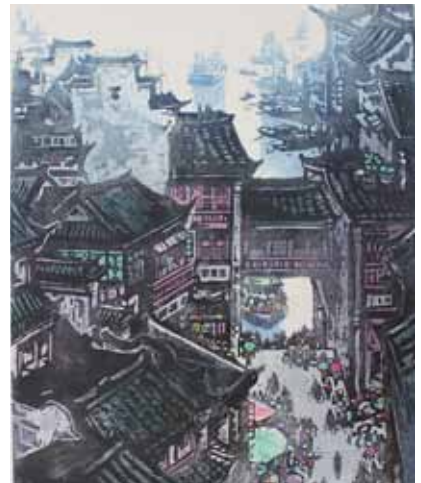
Zhixin Cai Embarcadère près du fleuve Qingyi gravure sur bois en couleurs, 1985 Coll. Musée de Gravelines