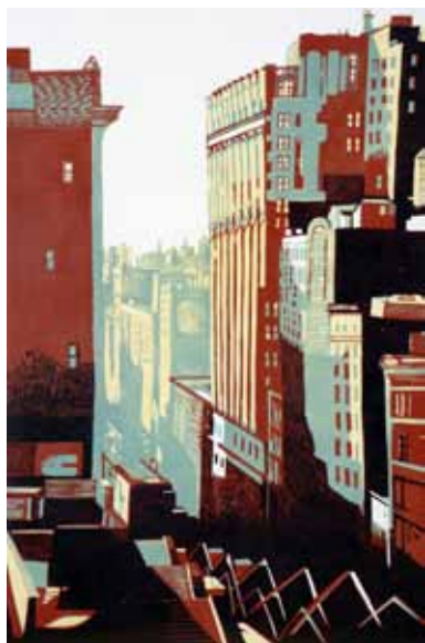
Pascale Hémary Vue du Flatiron Building, New York, 2014, gravure sur bois en couleurs 120 x 80 cm (coup de planche) 140 x 100 cm (feuille)