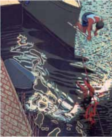
Wendelien Schönfeld Narcisse , 2000 gravure sur bois en couleurs 50 x 41 cm (coup de planche) 66 x 52 cm (feuille) Coll. Musée de Gravelines