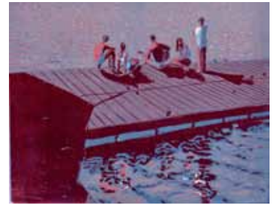
Wendelien Schönfeld Sérénade , 2011 gravure sur bois en couleurs 19 x 24 cm (coup de planche) 26 x 37 cm (feuille)