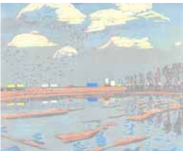
Wendelien Schönfeld Holendrecht , 2005 gravure sur bois en couleurs 30 x 35 cm (coup de planche) 38 x 50 cm (feuille)