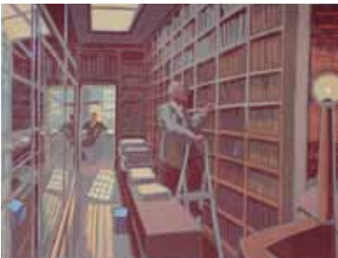
Wendelien Schönfeld Hôtel Turgot, La Bibliothèque , 2008 gravure sur bois en couleurs 30 x 40 cm (coup de planche) 37 x 50 cm (feuille)