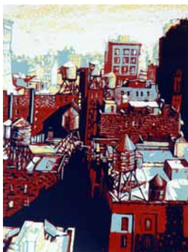
Pascale Hémary View from a window in Manhattan 2016, linogravure en couleurs