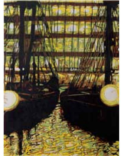
Pascale Hémery, St-Katharine docks in the City, London 2014, gravure sur bois en couleurs Coll. Musée de Gravelines