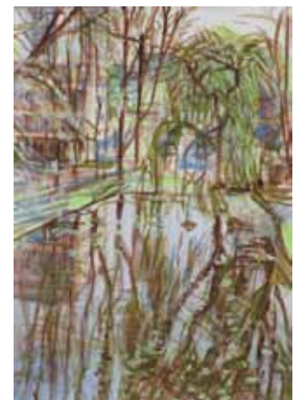
Wendelien Schönfeld Étang , 2012 gouache 32 x 24 cm (feuille)