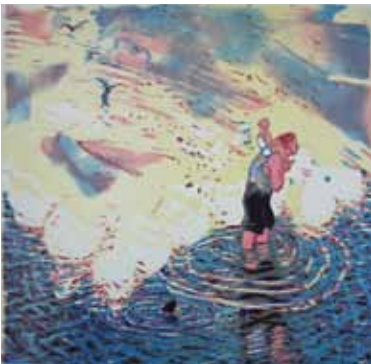
Wendelien Schönfeld Saint-Christophe , 2000 gravure sur bois en couleurs 50 x 50 cm (coup de planche) 51 x 51 cm (feuille)