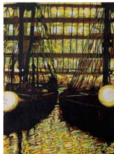
Pascale Hémary St-Katharine docks in the City, London 2014, gravure sur bois en couleurs 80 x 60 cm (coup de planche) 100 x 70 cm (feuille) Coll. Musée de Gravelines