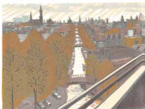
Wendelien Schönfeld Nassauplein vers le Nord 2004, gravure sur bois en couleurs