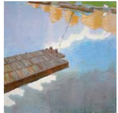
Wendelien Schönfeld Escalier vers le paradis 2016 gravure sur bois en couleurs 30 x 30 cm (coup de planche) 37 x 38 cm (feuille)