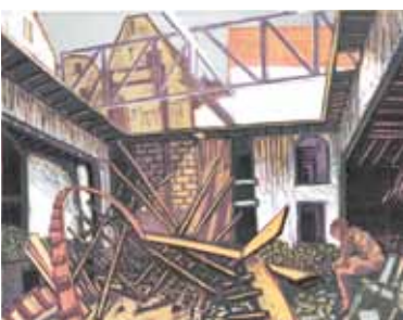
Wendelien Schönfeld Job , 1998 gravure sur bois en couleurs 25 x 33 cm (coup de planche) 37 x 44 cm (feuille)