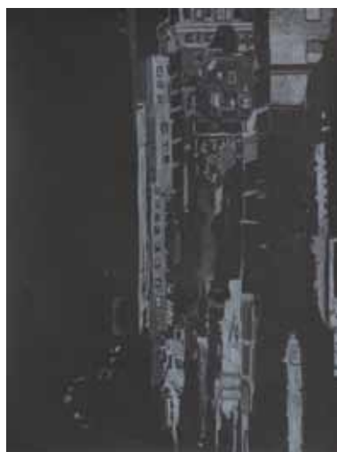
Pascale Hémary Union Square, New York, Série noire # 1, 2016 dessin à la craie blanche sur papier noir 65 x 50 cm (feuille)