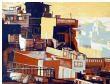
Pascale Hémary Udaipur I 2014, gravure sur bois en couleurs 60 x 80 cm (coup de planche) 70 x 90 cm