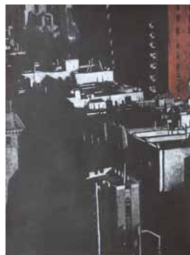
Pascale Hémary From the Heights, New York, Série noire # 2-2, New York 2016, dessin aux crayons de couleurs sur papier noir 65 x 50 cm (feuille)