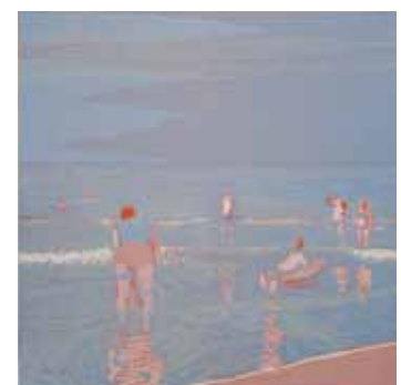
Wendelien Schönfeld Plage II , 2017 gravure sur bois en couleurs 23 x 23 cm (coup de planche) 27 x 34 cm (feuille)