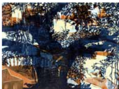
Pascale Hémary Le Banian d'Udaipur 2014, gravure sur bois en couleurs 60 x 80 cm (coup de planche) 70 x 90 cm (feuille)