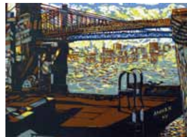
Pascale Hémary Embarquement to Brooklyn 2017, linogravure en couleurs 40 x 55 cm (coup de planche) 65 x 50 cm (feuille) Coll. Musée de Gravelines