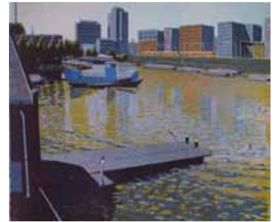
Wendelien Schönfeld Dijksgracht , 2011 gravure sur bois en couleurs 33 x 39 cm (coup de planche) 37 x 50 cm (feuille)