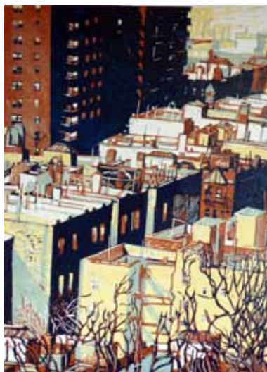
Pascale Hémary From the Heights I, New York 2016, linogravure en couleurs 50 x 36 cm (coup de planche) 65 x 50 cm (feuille)