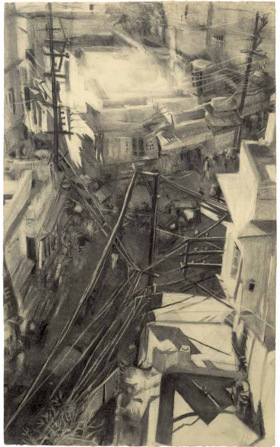
SUITE INDIENNE : LE TRAFIC • 2013 • FUSAIN • 104 x 63 cm.