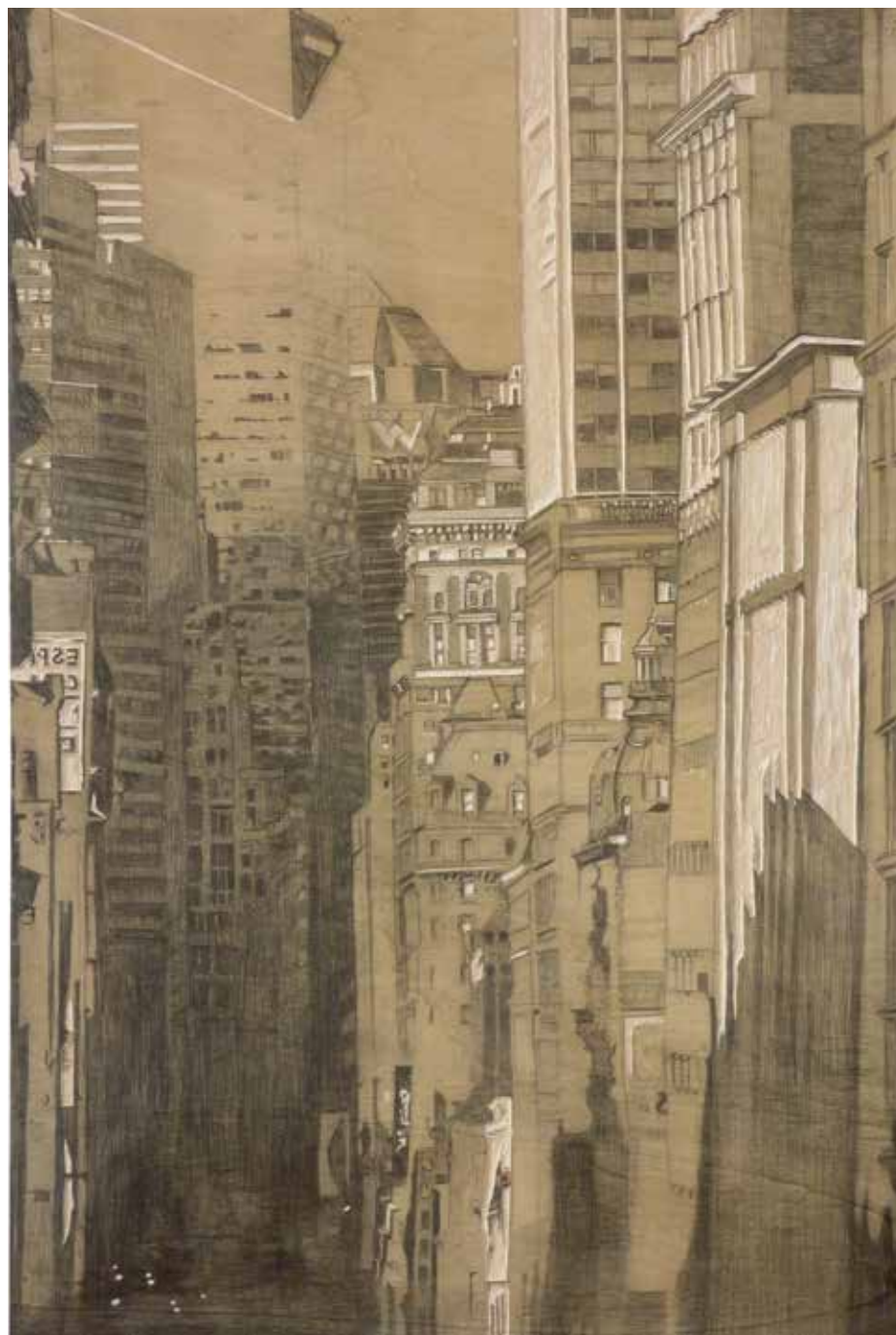
UNION SQUARE - NEW YORK • 2014 • DESSIN À LA MINE DE PLOMB SUR BOIS, EN VUE D'UNE GRAVURE • 120 x 80 cm.

PASCALE HÉMERY dessine l'envers des grandes villes. Elle donne à voir le côté cour ou le côté terrasse avec de vastes vues plongeantes, comme si elle se tenait au sommet du plus haut immeuble. Elle compose un fragment de ville silencieux avec un enchevêtrement de lignes qui laisse pressentir le chaos tout proche. Avec elle, la rêverie garde une grande précision de contour. Au fusain et parfois à la craie, elle parvient à faire vivre et respirer la surface d'un pan d'immeuble, elle fait vibrer le faisceau métallique d'une voie ferrée, elle restitue aux mastodontes urbains une part de douceur et de fragilité. Elle donne à ces dédales de ciment et de pierre la sensibilité d'un corps endormi.