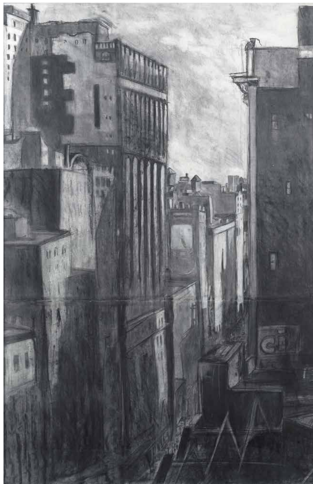
CI-CONTRE : VUE DU FLAT IRON BUILDING • 2012 • FUSAIN ET CRAIE • 120 x 80 cm.